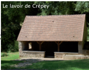
Le lavoir de Crépey

2 Contourner le pré par la droite puis quitter ce sentier au bout de 80 m et traverser à gauche pendant 250 m. Déboucher ainsi sur un chemin que l'on prend à gauche et qui mène jusqu'au lavoir, puis au hameau de Crépey.