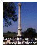
La colonne romaine à Cussy-la-Colonne

7 Prendre cette route à droite et rejoindre le village. En option (1 km) : face à la maisonnette (où logeaient les gardes-barrière), on peut prendre à droite un sentier, puis à droite un chemin goudronné qui conduit à la colonne romaine de Cussy-la-Colonne. Revenir par le chemin rectiligne qui arrive au village de Cussy-la-Colonne.