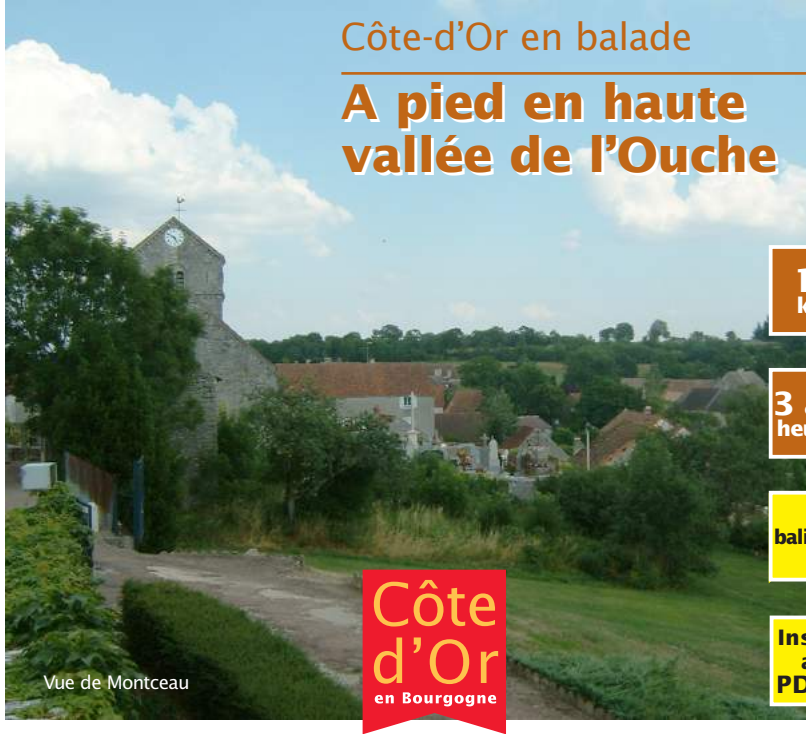
Vue de Montceau